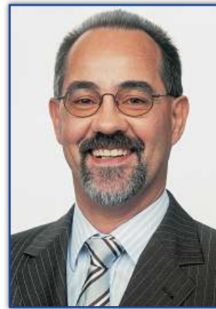
Rolf Franzen Bürgermeister

So wie die Stadt Zweibrücken seit vielen Jahren ihre Schulen in Schuss hält, um möglichst optimale Voraussetzungen für eine gute Bildung zu gewährleisten, so setzt sie sich auch für die Betreuung der jüngeren Kinder in den Kindertagesstätten ein.