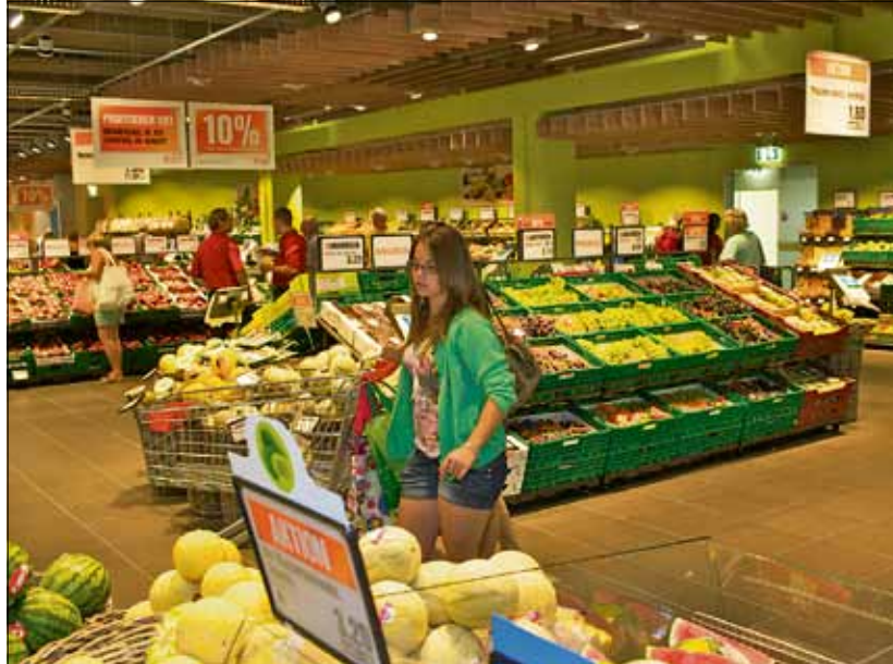
Das neue Konzept gefällt mit kräftigen Farben und grosszügigen Zirkulationsflächen.

Die Kunden finden bediente Theken für Fisch, Fleisch, Charcuterie und Käse, sowie eine