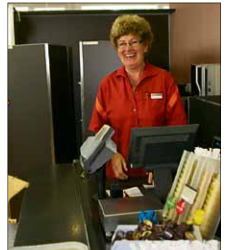
Auch dem Personal macht der «Tapetenwechsel» viel Spass.