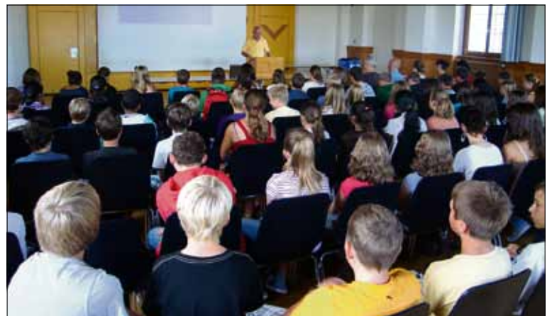
Interessierte und leicht nervöse Lernende hören gespannt den Worten des Schulleiters zu.

Im Schuljahr 2011/12 wird der Religionsunterricht in der Sekundarschule neu organisiert. Die Doppellektionen früherer Jahre werden mehrheitlich durch Religionshalbtage ersetzt. Die Betroffenen werden im Verlaufe der ersten Schulwochen orientiert.