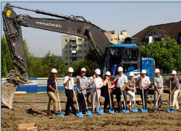
Spatenstich zum Bauprojekt Haslirainring in Perlen.

Nur einen Steinwurf vom neuen Autobahnanschluss Buchrain entfernt und mit den öffentlichen Verkehrsmitteln (Bus, Bahn) gut erreichbar, macht auch Perlen wohnenswert. Das Bauvorhaben, bestehend aus 2 Mehrfamilienhäusern, umfasst insgesamt 14 moderne und grosszügig konzipierte, 3½-Zimmer- und 4½-Zimmer-Wohnungen. Das Bauvolumen, inkl. Land, beläuft sich auf 7,5 Mio Franken. Der Bezug der Wohnungen ist im Frühherbst 2012 vorgesehen.